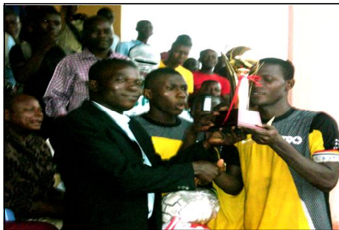
Le capitaine du Lycée Agoè-Ouest reçoit la coupe de M. Ouro Akondo

Le trophée de la 4 e édition du tournoi d'intégration scolaire des personnes handicapées est, cette année, allé au Lycée d'Agoè Ouest, vainqueur en finale de son homologue de Tokoin II par 3 buts contre 2 au stade d'Agoè. Le match de la 3 e place disputé en levée de rideaux a souri à l'équipe de Connaissance Plus, dominatrice de Réveil d'or par 2 buts à 0. La compétition débutée avec 16 établissements scolaires a été organisée par l'Association Togolaise pour les Droits Scolaires des Personnes Handicapées (ATDSPH).