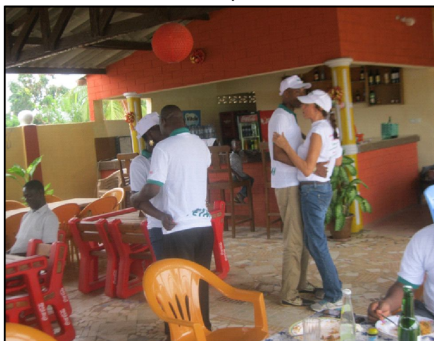
Esquisse de quelques pas de danse.

viendra », a-t-il renchéri avant de renouveler sa confiance au personnel, qu'il a exhorté au travail