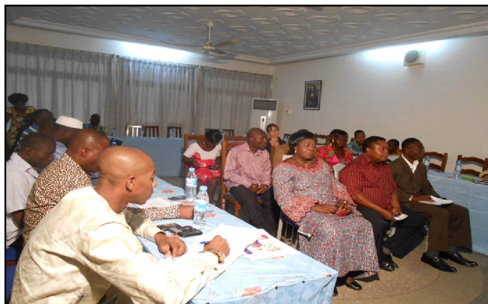
Participants, invités et quelques officiels à la cérémonie d'ouverture.

intérêts des personnes handicapées. Il mène des