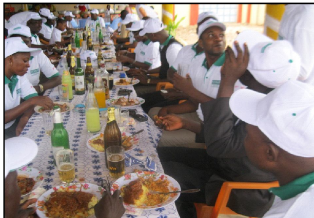
La fête a été bonne : le personnel s'est régalé avec divers plats et boissons.

Le directeur de programme, M. Katatchom a pour sa part adressé ses remerciements au Directeur des Personnes Handicapées pour sa constante disponibilité, pour son écoute. Idem pour les partenaires et pour le président de la FETAPH qui, en un an de gestion a, selon lui, « donné un nouveau souffle et un dynamisme » à la Fédération. Il a exhorté le personnel à se battre